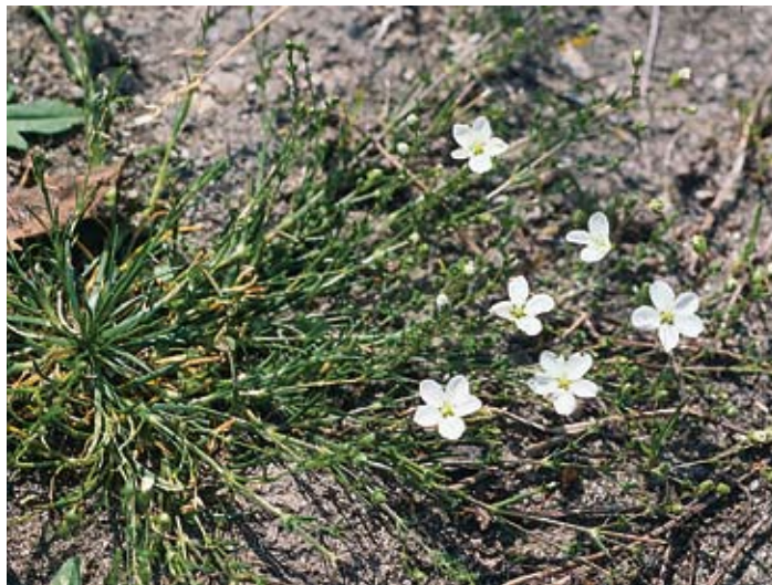
Figur 8. Knutnarv var vanlig på Liljas tid men tycks nu vara helt försvunnen från Billinge och Röstånga.

Rosa sherardii/villosa ssp. mollis – ludd/hartsros