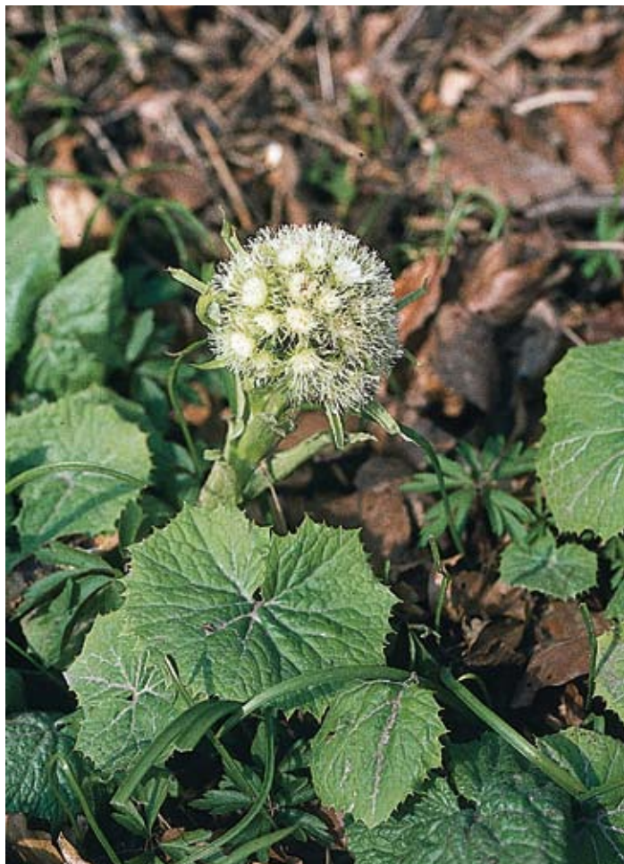
Figur 7. Vitskråp växer fortfarande vid Gunnaröd. Röstånga.

– Ononis spinosa ssp. arvensis – stallört