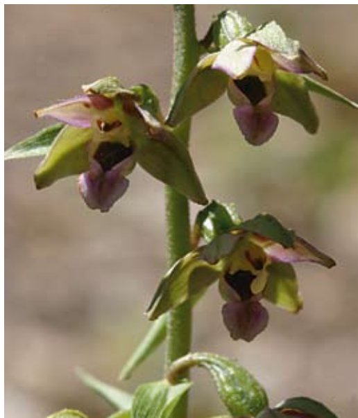
Figur 3. Lilja fann aldrig skogsknipprot i området. I dag är den känd från sex lokaler.

Carex sylvatica och skogsknipprot Epipactis helleborine ) samt ett par åkerogräs som funnits sedan gammalt i Skåne men som tydligen ökat starkt och först i sen tid etablerat sig i Billinge och Röstånga (baldersbrå Matricaria perforata och rågvallmo Papaver dubium ).