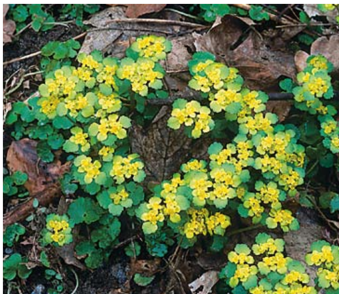
Figur 5. Gullpudra trivs i fuktiga skogar i Billinge och Röstånga.

+ Cerastium arvense – fältarv LILJA: – SkFl: 100 m S Furutorp och 500 m OSO Norregård i Röstånga.