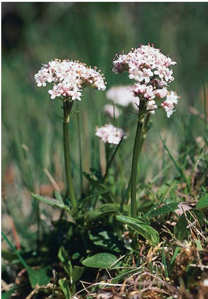
Figur 9. Småvänderot har möjligen gått tillbaka i Billinge och Röstånga.

SkFl: få ex på torrbacke 500 m VNV N. Hultseröd i Billinge.