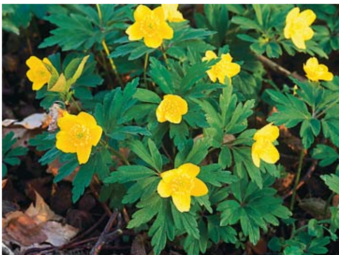
Figur 4. Gulsippa är en ganska vanlig ört i Billinge och Röstånga.

(+) Allium scorodoprasum – skogslök LILJA: – SkFl: 400 m NNV kyrkan i Röstånga.