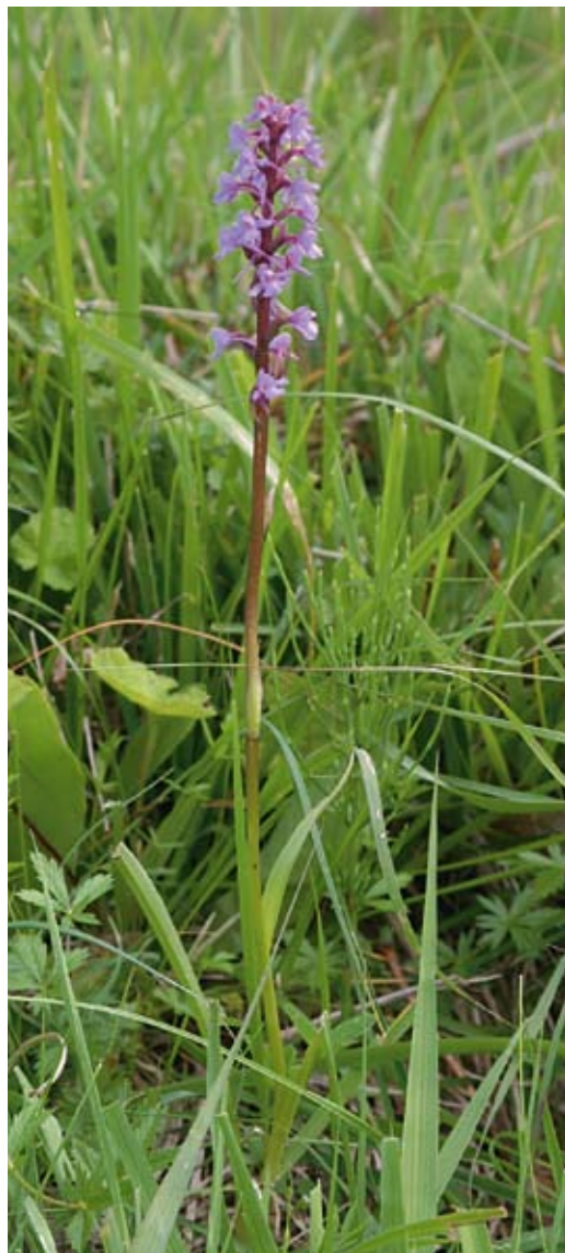
Figur 2. Brudsporre var vanlig i trakten på Liljas tid. Nu tycks den vara helt försvunnen.

eller fler lokaler under projektet och det känns därför tryggt att påstå att de av dessa arter som uppgivits från färre än 9 lokaler verkligen blivit ovanligare sedan Liljas tid. De arter som Lilja anger som förekommande ”här och där” eller ”rikligt” har i de flesta fall rapporterats från 3–8 lokaler under projekt Skånes Flora och jag vågar därför påstå att i de fall de under det senare projektet