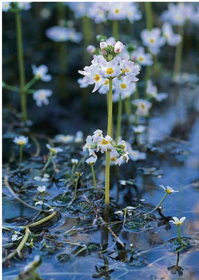
Figur 6. Vattenblink är en ganska ovanlig vattenväxt i Billinge och Röstånga.

+ Glyceria notata – skånsk mannagräs LILJA: – SkFl: 3 lokaler.